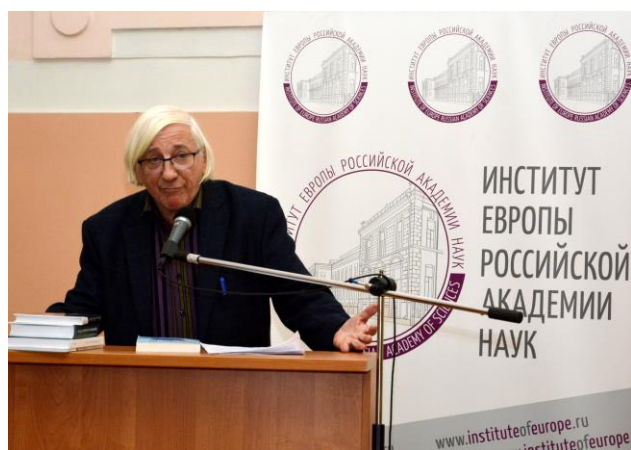
Жан-Поль Гуревич, писатель, публицист (Франция)

Институт Европы, «Русский мир», движения Евразийства в России, РПЦ и все другие конфессии в России могли бы взять на себя как вызов задачу вести этот труднейший, но перспективный диалог для решения нынешних и будущих проблем нашего мира